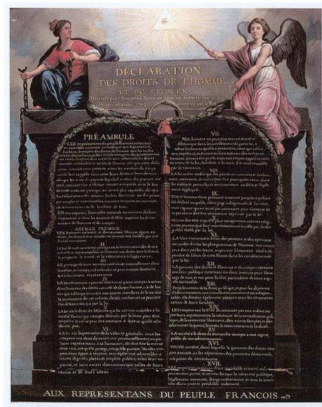
Obrázek: 1 – Deklarace práv člověka a občana z roku 1789

Ústavní základy a podoba dnešního politického systému Francie je do jisté míry ovlivněna historickými dokumenty, zejména pak Deklarací práv člověka a občana, z roku 1789. Tato deklarace ovlivnila řadu dalších zemí a inspirovala se z nich například také česká Listina základních práv a svobod. Podobu tohoto dokumentu vyjadřuje následující obrázek.